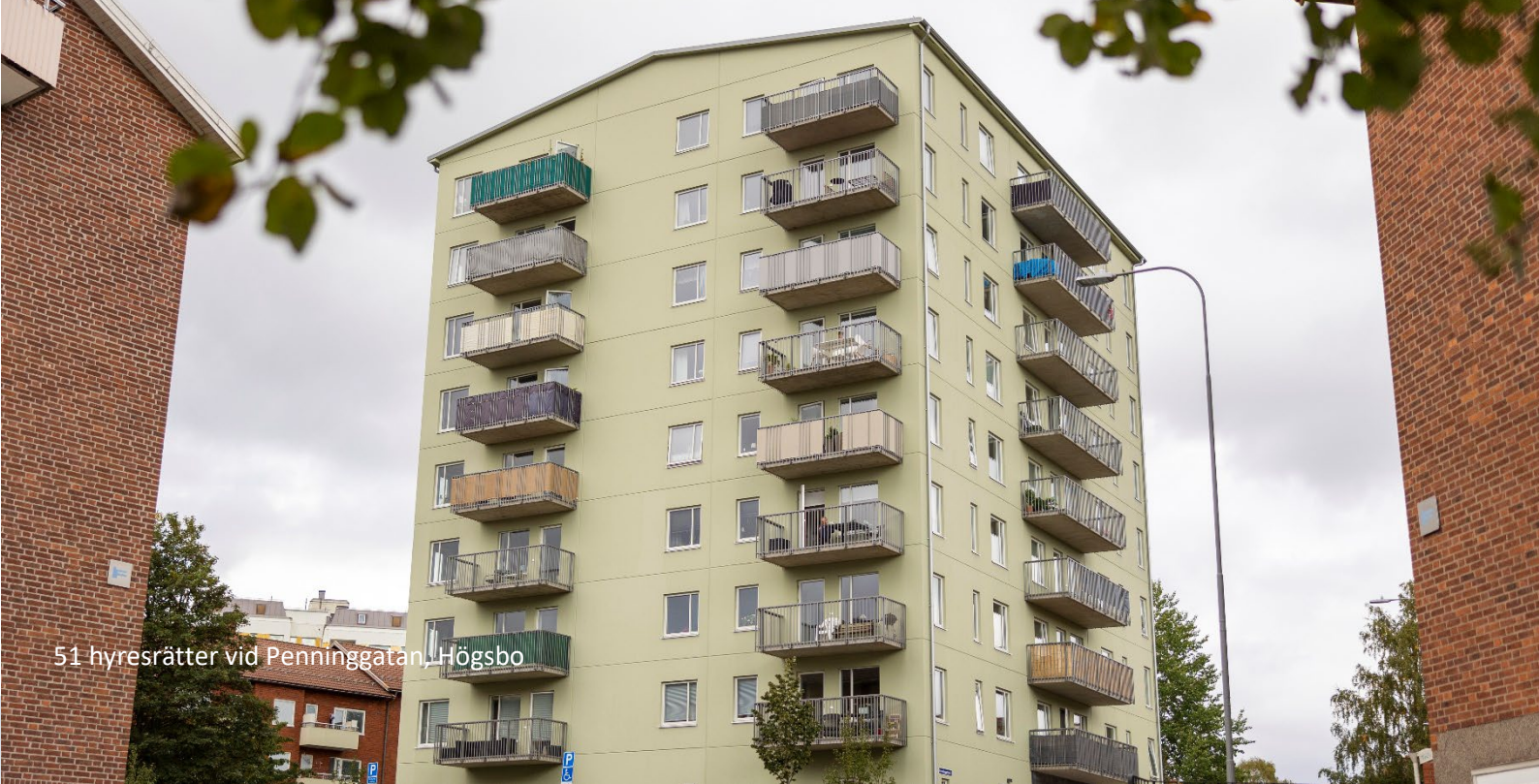
51 hyresrätter vid Penninggatan, Högsbo