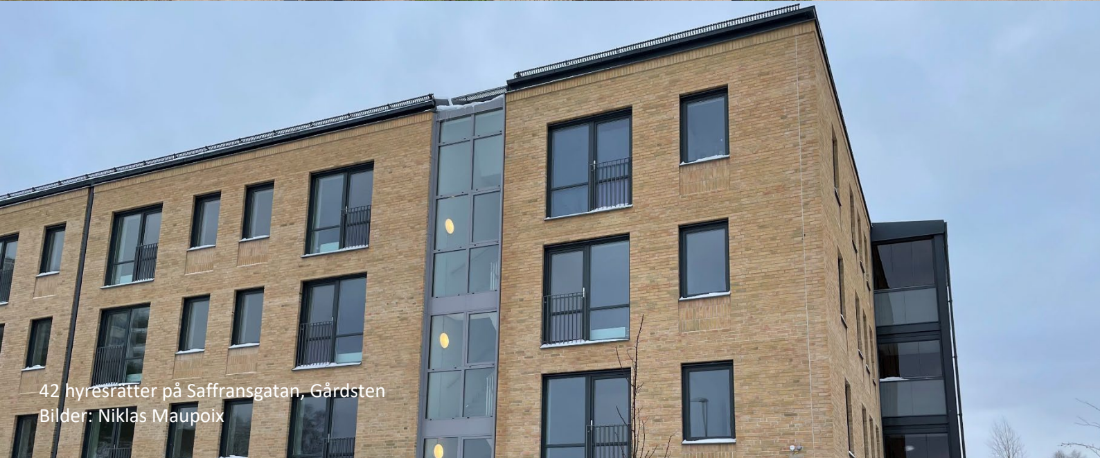
42 hyresrätter på Saffransgatan, Gärdsten