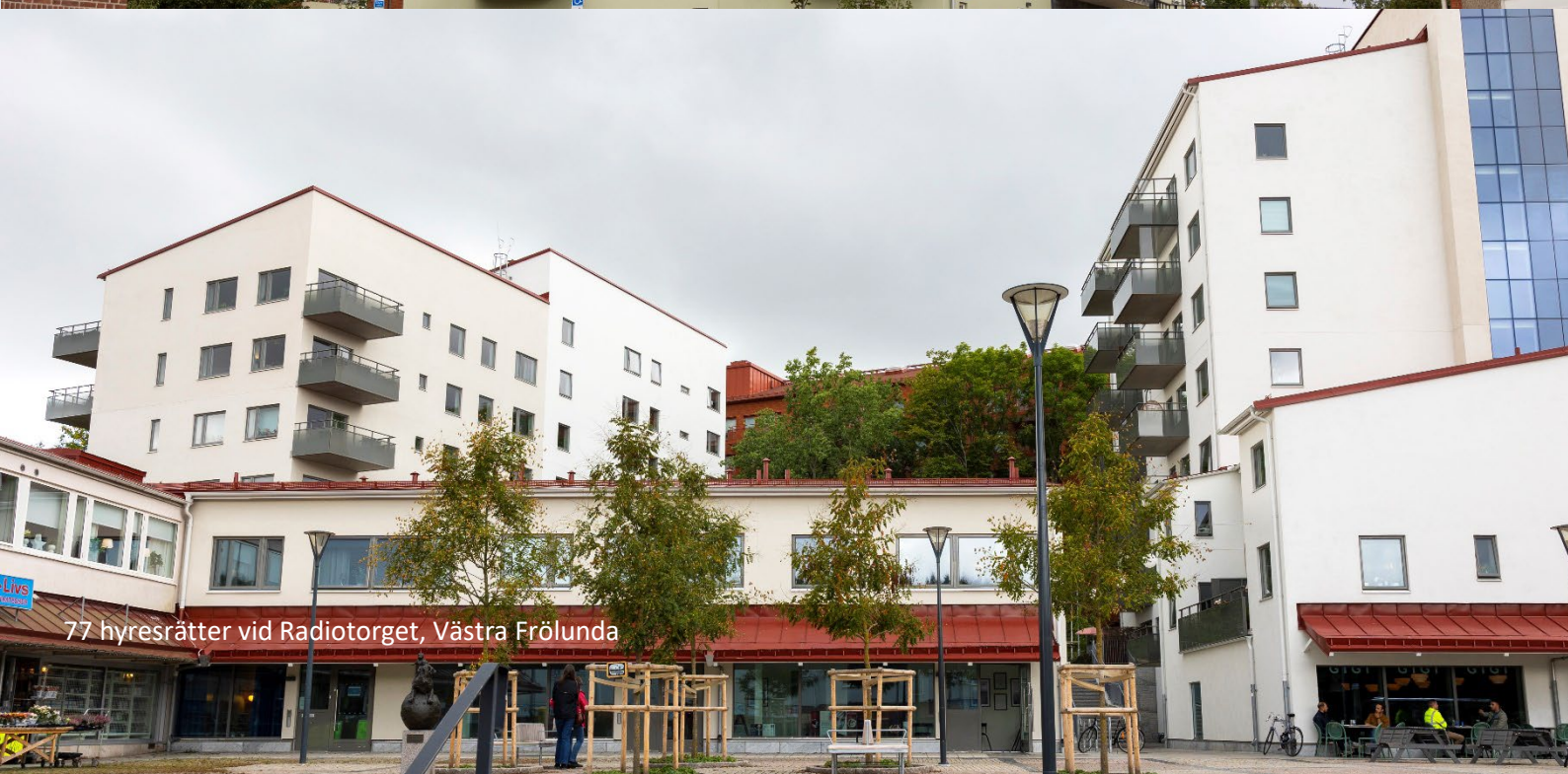
77 hyresrätter vid Radiotorget, Västra Frölunda